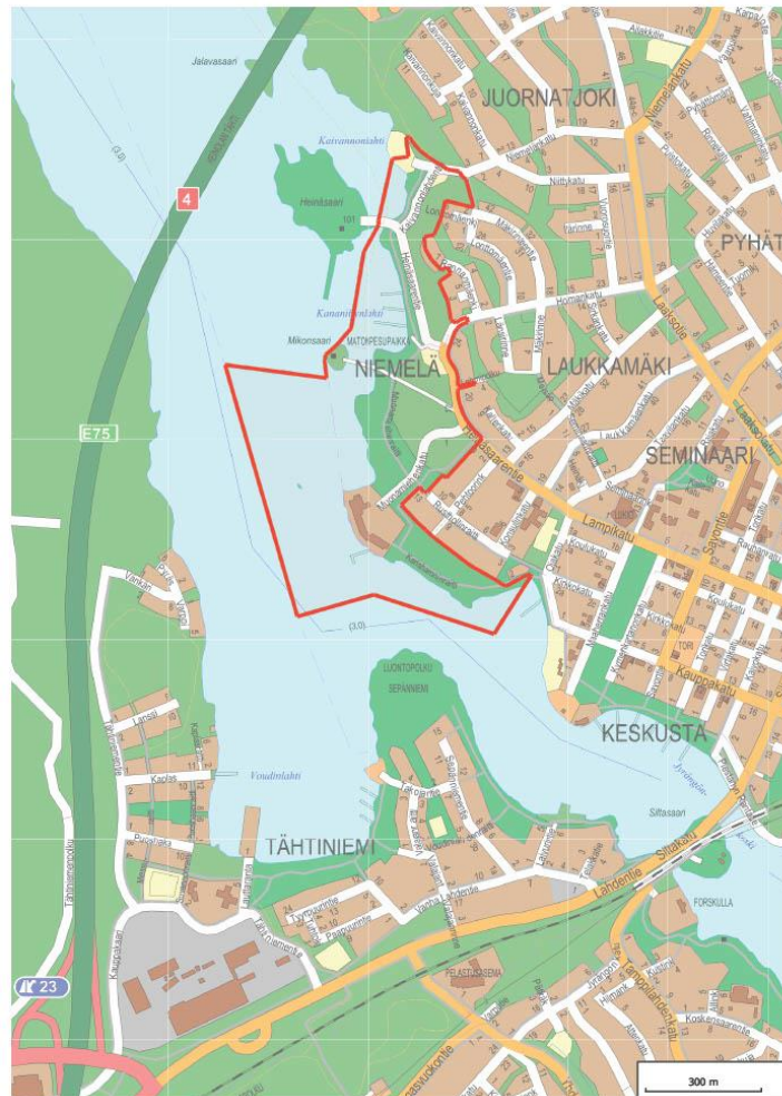
Suunnittelualueen sijainti ja rajaus.

Asemakaavan muutos koskee Niemelän (10.) kaupunginosan korttelin 37 tonttia 1, korttelin 40 tonttia 1, korttelin 41 tonttia 1 sekä joko kokonaan tai osia seuraavista kiinteistöistä Niemelän ja Juornatjoen (12.) kaupunginosissa: 111-10-9906-100, 111-10-9903-200, 111-10-9906-200, 111-10-9903-100, 111-10-9903-300, 111-10-9903-400, 111-10-9901-0, 111-406-3-124.