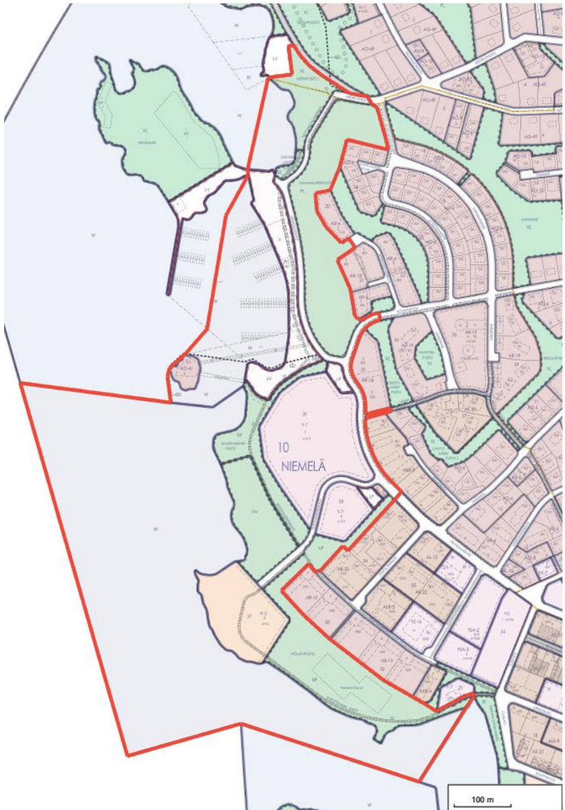
Ote ajantasa-asemakaavasta maankäyttövarausten värein, kaavan muutosalueen rajausta punaisella.